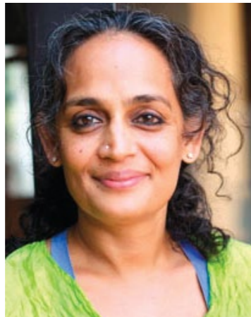
↑ അരുന്ധതി റോയി

കത പുലർത്തുകയും ബാപ്റ്റിവിന്റെ വിശ്വാസങ്ങൾക്ക് ഒത്തുപോകുന്നതും, വരുമാനം എല്ലാവരുടെയും നന്മക്കുവേണ്ടി ഉപയോഗിക്കുകയും ചെയ്യുന്ന കമ്പനികൾക്കുമാത്രമേ അനുമതി നൽകുമായിരുന്നുള്ളൂ. ഹരിജൻ ഫണ്ട് സമാഹരിക്കാൻ ബാപ്റ്റി തന്റെ ഓട്ടോഗ്രാഫും ഫോട്ടോയും വിറ്റ് സമാനമായത് ചെയ്തിട്ടുണ്ട്. അതിനാൽ