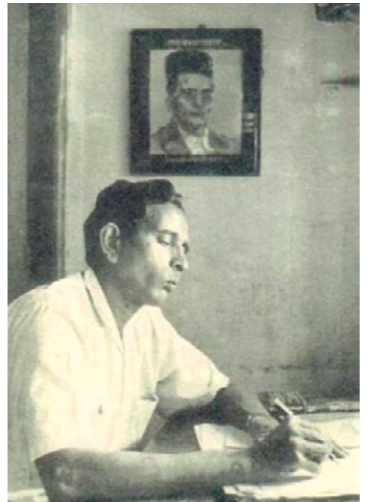
↑ ഗോപാൽ ഗോദ്സെ -പഴയചിത്രം

● രോഷത്തിൽനിന്നാണ് 'ലെറ്റ്സ് കിൽ ഗാന്ധി' ജനിക്കുന്നത്. ബാപ്റ്റിവിന്റെ ഘാതകരമായ ഹിന്ദുത്വശക്തികൾ അഴിച്ചുവിട്ട പ്രചാരണത്തിലാണ് എനിക്ക് ദേഷ്യം തോന്നിയത്. 'ഗാന്ധിയന്മാരുടെ' മൗനം എന്നെ കൂടുതൽ രോഷം കൊള്ളിച്ചു. അങ്ങനെ സത്യം സ്വയം കണ്ടെത്തണമെന്നും അത് ജനങ്ങളുമായി പങ്കുവെക്കണമെന്നുമുള്ള തീരുമാനത്തിൽ ഞാൻ എത്തി. ബാപ്റ്റിവിന്റെ കൊലപാതകത്തിന് മൊത്തം ബ്രാഹ്മണ സമുദായത്തെ കുറ്റപ്പെടുത്തുന്ന തരത്തിൽ എനിക്കെതിരെ ഉയർന്ന വികാരം ഒരു റിപ്പോർട്ടറുടെ ബോധപൂർവ്വമായ തെറ്റായ റിപ്പോർട്ടിങ്ങിന്റെ ഫലമായാണ്. ബാപ്റ്റിവിന്റെ കൊലപാതകത്തിന് ഞാൻ ബ്രാഹ്മണരെ കുറ്റപ്പെടുത്തിയെന്ന രീതിയിൽ പി.ടി.ഐ റിപ്പോർട്ടർ എഴുതുന്നത് ഞാൻ കണ്ടു. ഞാൻ പറഞ്ഞത് ബാപ്റ്റിവിന്റെ കൊലപാതകത്തിന് കു