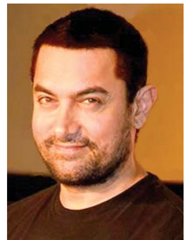
↑ അമീർ ഖാൻ

‘അപരിഷ്കൃതരെ പരിഷ്കൃത’രാക്കുന്നുവെന്ന പേരിൽ ക്രിസ്തുമതപ്രചാരകർ നടത്തിയ അതിക്രമങ്ങൾ ഐ.എസും ബോക്സോഫറാമും നടത്തുന്ന അക്രമങ്ങൾക്ക് മുന്നിൽ ഒന്നുമല്ല എന്ന് അടുത്തിടെ താങ്കൾ പറഞ്ഞിരുന്നു. എന്താണ്