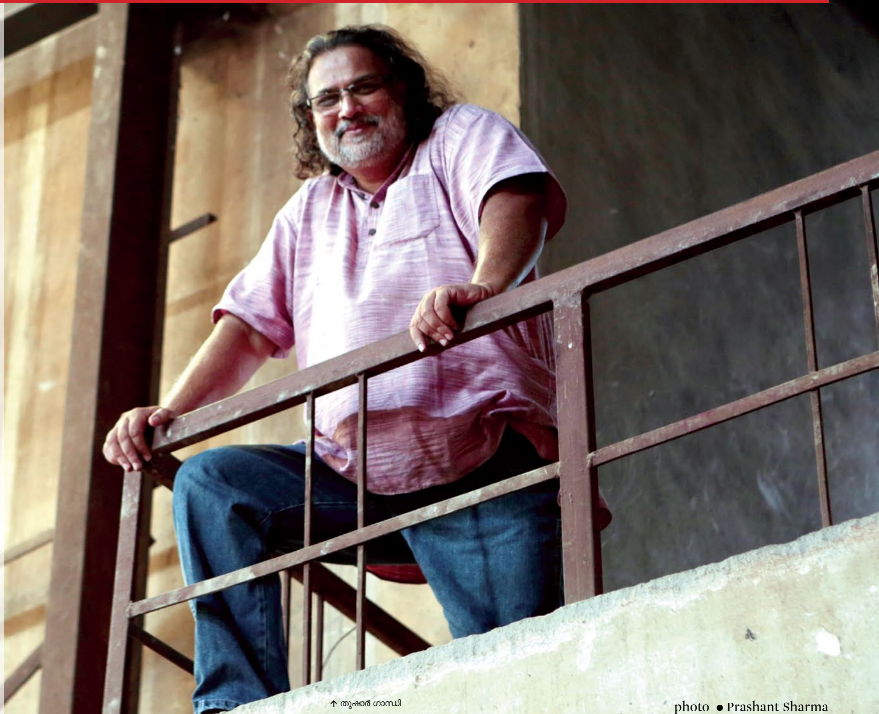
↑ തുഷാർ ഗാന്ധി